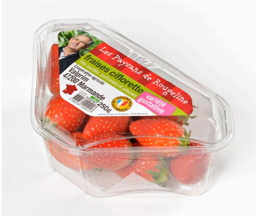
Barquette triangulaire 250g