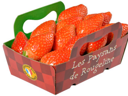
Barquette carton à anses 250g