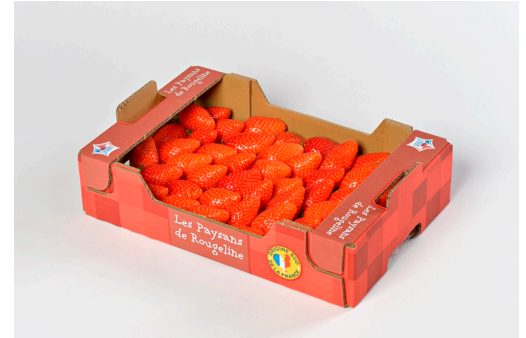
Mini colis 800g